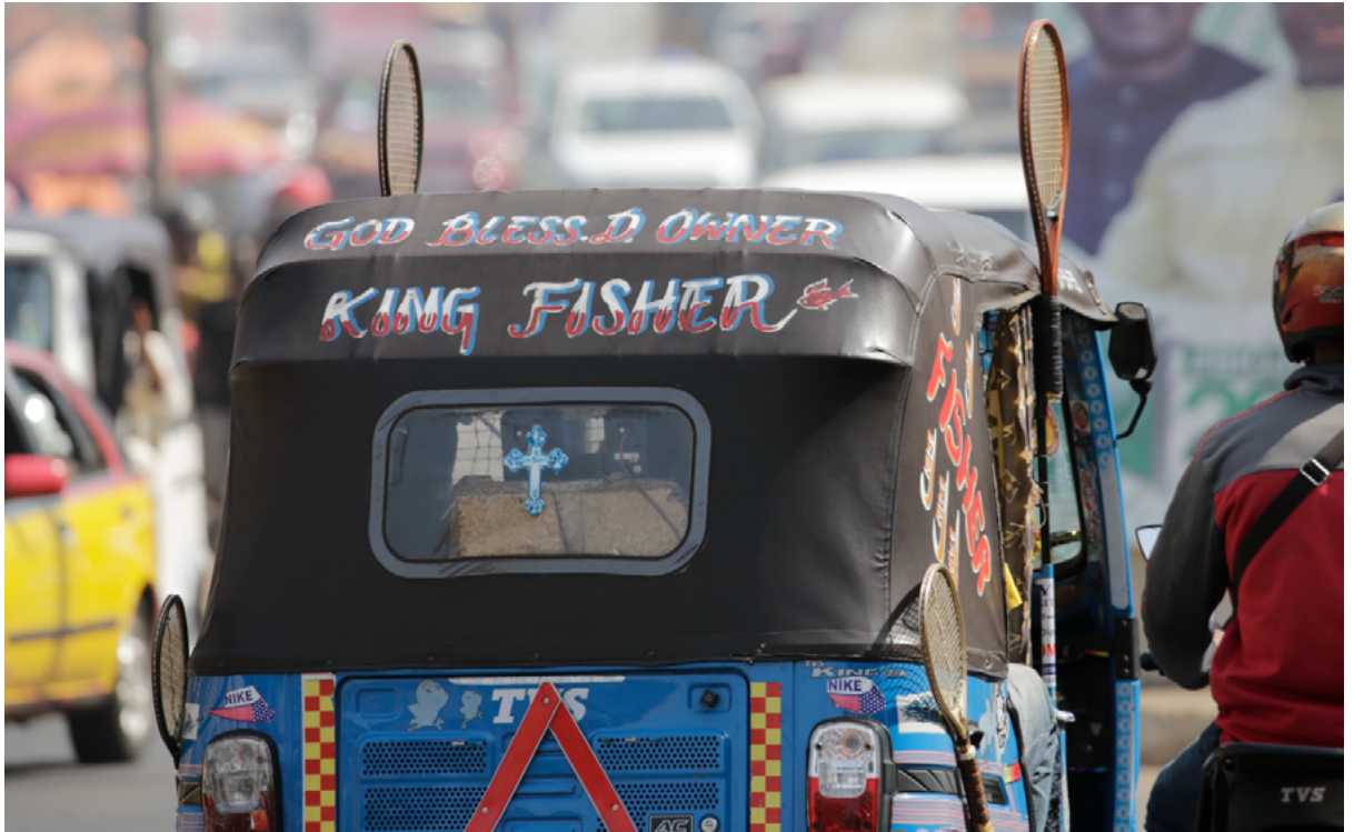
Keke i Freetown. Ejeren af denne keke kalder den for King Fisher, har sat et kors i bagruden og pyntet med gamle tennisketsjere. 'God bless D (=the) owner' står der øverst.