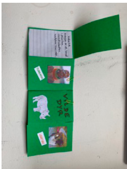
Hver "side" har en flap, der kan løftes